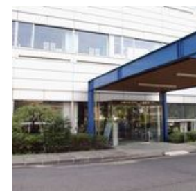
いばらき量子ビーム研究センター玄関