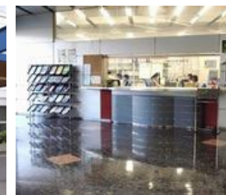
ユーザーズオフィス外観